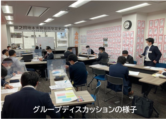
グループディスカッションの様子

2020年度第2回地本・支部役員セミナーが4月17日(土)に中央本部会議室で開催されました。北九州支部からは3名が出席しました。