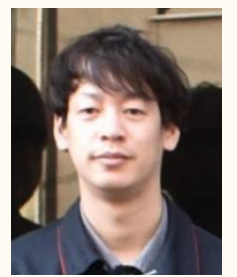
富高一氣副分会長