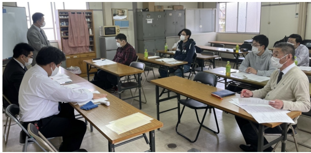
第1回拡大分会代表者会議の様子

3月26日13時から北九州支部会議室において、第1回拡大分会代表者会議が開催されました。マスクの着用・アルコール消毒の徹底・換気など、新型コロナウイルス感染症防止対策を徹底して行いました。