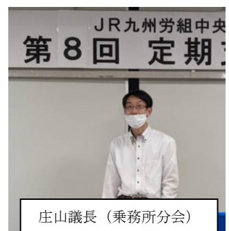
庄山議長（乗務所分会）