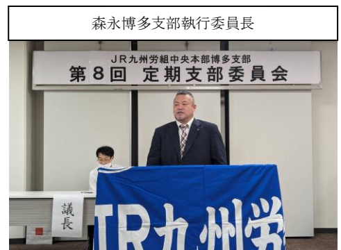
森永博多支部執行委員長