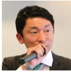
田中 雅臣 県議