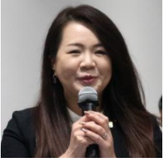
室屋 美香 県議