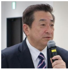
古賀 之士 参議院議員