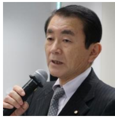
野田 国義 参議院議員