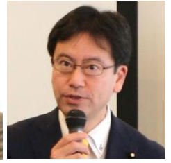
城井 崇 衆議院議員