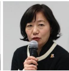
堤 かなめ 衆議院議員