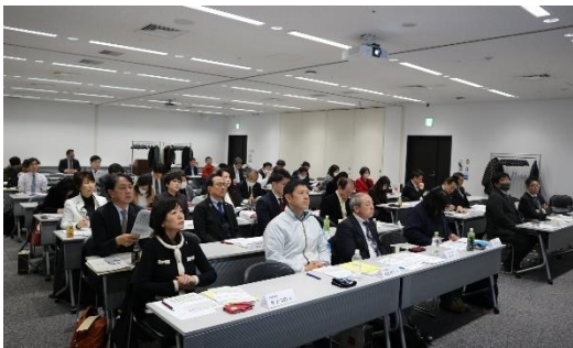
福岡地区の様子（JR博多シティ会議室）

JR連合福岡県協とJR九州労組中央本部は、福岡県の交通重点施策意見交換会を、北九州地区（2月10日・場所：北九州国際会議場）及び福岡地区（2月11日・場所：JR博多シティ会議室）に分けて本年も実施した。意見交換会には、JR連合の政策課題解決に向けてご尽力いただいている議員の方々とJR九州労組の各支部の役員等、総勢81名が参