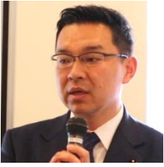
佐々木 允 県議