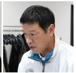
稲富 修二 衆議院議員